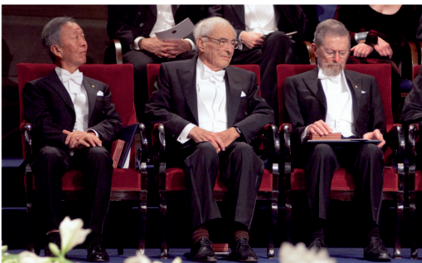
Kao, Boyle y Smith, durante la entrega de galardones de los Premios Nobel 2009

No cabe duda alguna que los Premios Nobel de física del año 2009 resumen la revolución de la tecnología audiovisual: el primero gracias a una idea inesperada, el segundo por el interés de saber más sin ninguna causa en concreto, pero en ambos casos siguiendo la pista de la intuición y no de los hechos ■